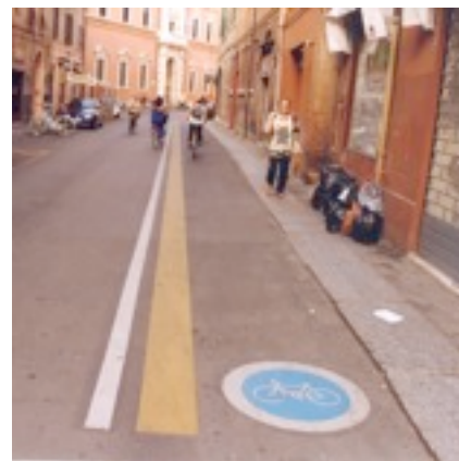
Ferrara - Pista ciclabile in centro

Ad inizio e fine della pista prevedere un abbassamento del marciapiede.