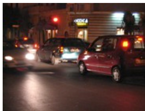
Fig. 1 - Traffico a San Ferdinando di Puglia

Se a San Ferdinando gli spostamenti avvenissero sulla base dei paradigmi della mobilità sostenibile e si scoprisse che la bicicletta è una valida alternativa all'automobile per le distanze fino ai 5 chilometri, il volto della città e la qualità della vita migliorerebbero radicalmente.