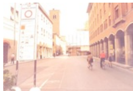
Ferrara - Tutto il centro è Zona a Traffico Limitato.