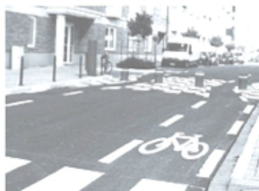
Pista ciclabile Cultraï - Belgio

Alcune nozioni tecniche di base in materia di piste ciclabili.