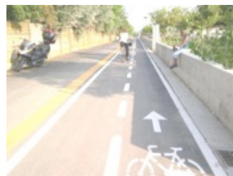
Pista ciclabile a due sensi di marcia - Reggio Emilia