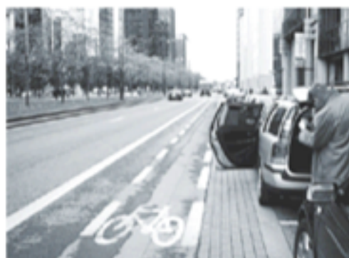
Coultrais (Belgio) - Pista ciclabile

Pista ciclabile a senso unico di circolazione di 1.5 m di larghezza.