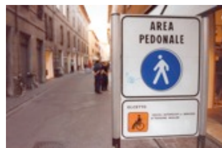
Ferrara - Zona pedonale interdetta al traffico automobilistico.