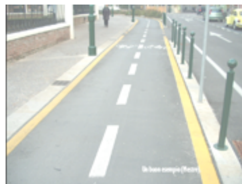
Pista ciclabile separata e protetta - Mestre