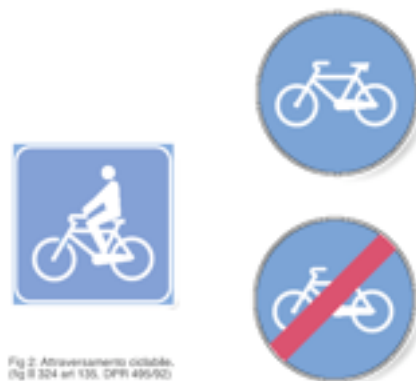
Fig 2: Attraversamento ciclabile. (fig II 524 art 135, DPR 495/92)