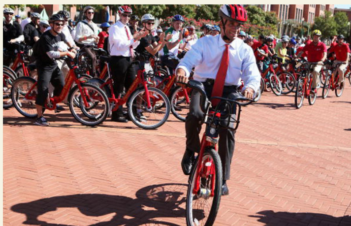
A WASHINGTON IL SINDACO ADRIAN FENTY INAUGURA IL BIKE SHARING PIÙ GRANDE DEGLI STATI UNITI - 1.100 biciclette in più di cento stazioni - Alex Wong - Getty Images.