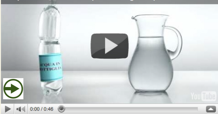
acqua in brocca VS acqua in bottiglia di plastica

C'è una città che dello “Zero” in politica amministrativa ha fatto una bandiera. In negativo. Ne ha collezionati una serie infinita. Uno zero dopo l'altro, in una sconcertante progressione, ha contabilizzato con trionfo orgoglio la propria aritmetica del nulla.