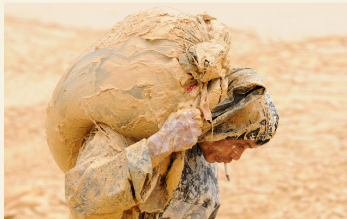
UN MINATORE NEL DISTRETTO CINESE DI NANCHENG.

«I clienti del Gruppo BNP, e in Italia di BNL, hanno il diritto di sapere come la banca utilizza il denaro depositato e di chiedere di fermare gli investimenti nel settore nucleare. Il Brasile, come l'Italia, non ha bisogno dell'elettricità prodotta dal nucleare, disponendo di abbondanti risorse rinnovabili come il vento, l'idroelettrico e le biomasse, tutte meno costose e infinitamente più sicure». ● Progetto nucleare Angra3