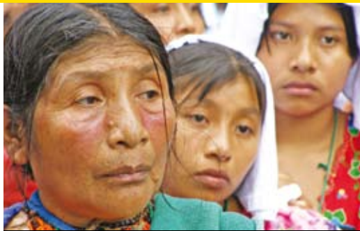
La scelta di Giulio