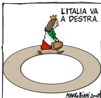
Moderazione del traffico: primi passi incerti

57 attraversamenti pedonali rialzati nelle intersezioni stradali più pericolose,