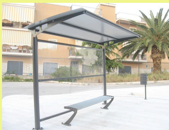
La fermata autobus fantasma a San Ferdinando di Puglia

A San Ferdinando di Puglia c'è una sola fermata autobus , in un angolo sperduto del paese, di un servizio autobus fantasma . E' un tipico esempio di come i soldi dei cittadini siano sperperati con disinvoltura dai nostri politici . La nostra proposta : Un primo intervento di mobilità dolce potrebbe prevedere l'istituzione di un servizio pubblico di trasporto , un autobus ecologico per rendere gli anziani autonomi nei loro spostamenti . Perché non avviare anche a San Ferdinando di Puglia un trasporto pubblico cittadino efficiente e rispettoso degli equilibri ambientali, che contribuisca a ridurre il numero degli spostamenti urbani in automobile ? Il comune virtuoso di Correggio , solo per fare un esempio, ha istituito il Bus navetta "Quirino" , dal nome del santo > pag 3