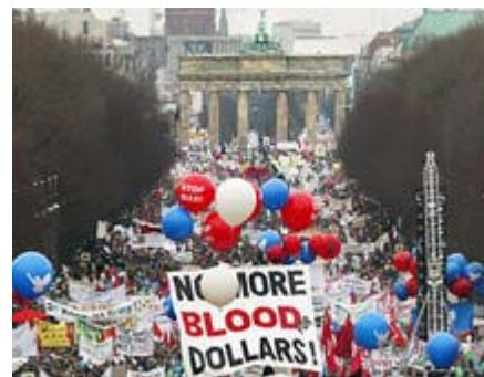
Manifestazioni pacifiste in Germania. Sullo sfondo la Porta di Brandeburgo

MILANO (CNN) -- Milioni di persone in tutto il mondo sono scese in piazza, sabato, per marciare contro la guerra. Dalla Nuova Zelanda agli Stati Uniti.