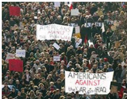
Anche a Parigi migliaia di persone in piazza

In Francia le manifestazioni sin sono svolte in 60 città sparse per tutto il territorio della nazione e hanno coinvolto centinaia di migliaia di francesi. Duecento mila persone hanno sfilato in silenzio nelle strade parigine. Nel resto del Paese le manifestazioni dovrebbero aver coinvolto altre centinaia di migliaia di francesi.