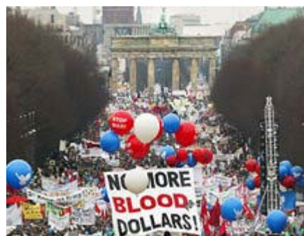
Manifestazioni pacifiste in Germania. Sullo sfondo la Porta di Brandeburgo

MILANO (CNN) -- Centodieci milioni di persone in tutto il mondo sono scesi in piazza, sabato, per marciare contro la guerra. Lo ha affermato la CNN, che ha stilato un bilancio di una giornata di manifestazioni in tutto il mondo, dalla Nuova Zelanda agli Stati Uniti.