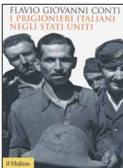
Flavio Giovanni Conti "I prigionieri italiani negli Stati Uniti" il Mulino (2012), pag. 544, € 28

Non tutte le prigionie furono uguali. È nota la dura sorte degli internati in Germania, così come quella dei prigionieri nell'Unione Sovietica. Per quanto riguarda i prigionieri degli Alleati occidentali i 408.000 detenuti dagli inglesi furono trattati con atteggiamento piuttosto rigido, ma nel complesso rispettoso delle norme della Convenzione. I francesi, invece, memori della dichiarazione di guerra dell'Italia alla propria nazione, riservarono ai prigionieri italiani un trattamento molto duro. Gli americani, nell'insieme, garantirono condizioni di vita migliori ai prigionieri e una applicazione più favorevole delle norme internazionali. L'Autore, che ha scritto vari saggi e articoli sull'argomento, precisa che dei 125.000 prigionieri italiani in mano agli americani, 51.000 furono quelli trasferiti negli Stati Uniti. Si trattava in larga misura di militari catturati dagli Alleati nella primavera-estate del 1943, durante la fase finale della campagna in Africa settentrionale e nel corso dello sbarco in Sicilia. In molti casi erano militari catturati dagli inglesi e assegnati poi agli ameri-