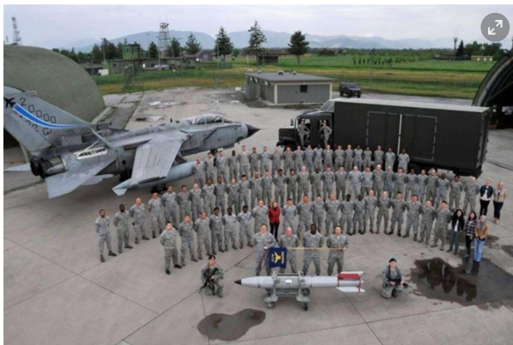
Ghedi, 2018: foto ricordo con missile nucleare B-61

La denuncia è stata illustrata stamattina in una conferenza stampa svoltasi di fronte alla base militare di Ghedi, dove sarebbero presenti ordigni nucleari. Altri nella base aerea di Aviano (Pn) utilizzata dall'Usaf, l'aeronautica militare statunitense. La denuncia fa seguito alla richiesta di uno studio alla Sezione italiana di Ialana, (International Association of Lawyers Against Nuclear Arms), giuristi impegnati contro le armi nucleari, per un parere sulla legalità delle armi nucleari, confluito nello studio "Parere giuridico sulla presenza di armi nucleari in Italia" edito da Multimage l'anno scorso. Nell'esposto si chiede agli inquirenti di accertare anche le eventuali responsabilità penali su chi ha importato gli ordigni e ne ha autorizzato l'importazione e la successiva detenzione.