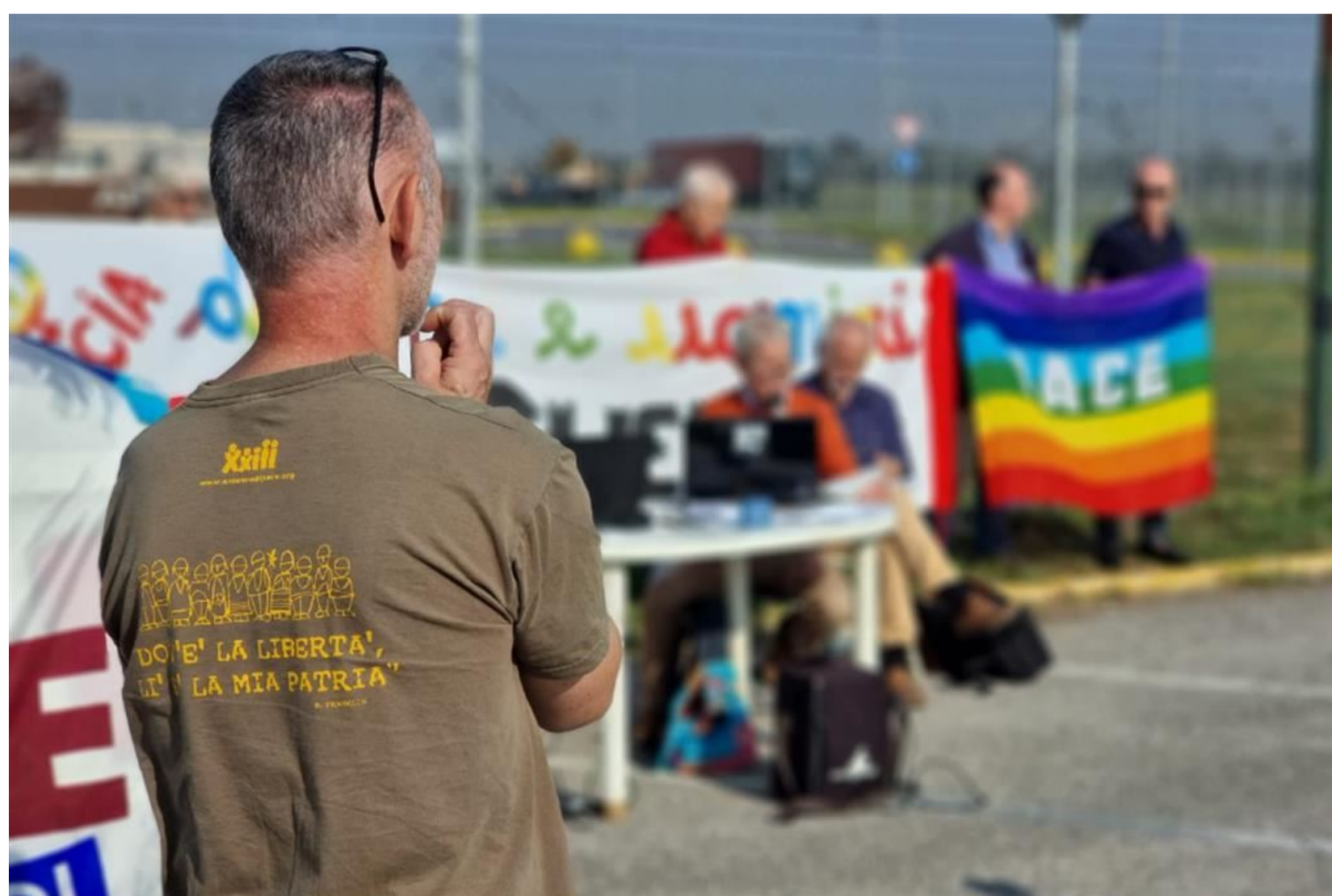
La presentazione della denuncia davanti alla base militare di Ghedi, nel bresciano - Associazione papa Giovanni XXIII

Denuncia di associazione pacifiste (tra cui Papa Giovanni XXIII e Pax Chirsti) per accertare la presenza di testate nucleari nella base aerea italiana e in quella Usaf di Aviano (Pn)